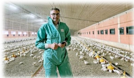
Rycina 2. Jeden rząd lamp w kurniku